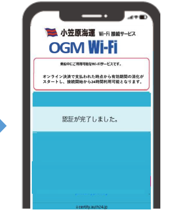
「認証が完了しました」と表示され、利用可能となる