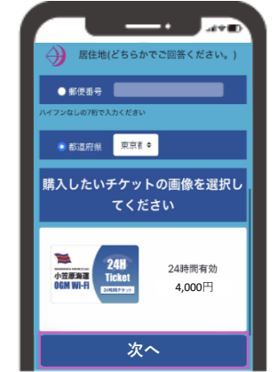
アンケート回答後チケットを選択し「次へ」をタップ