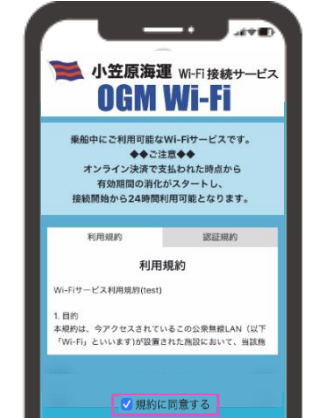
利用規約を読んで同意するにチェックを入れる