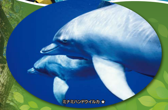
ミナミハンドウイルカ★