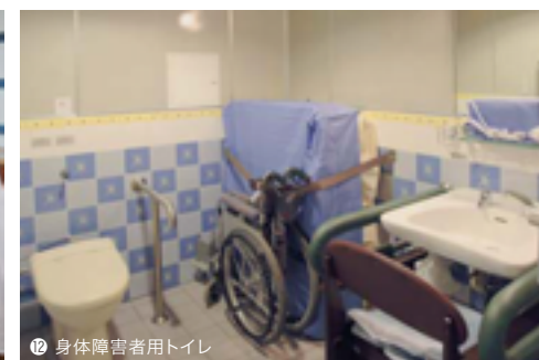
⑫ 身体障害者用トイレ