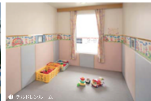
⑪ チルドレンルーム