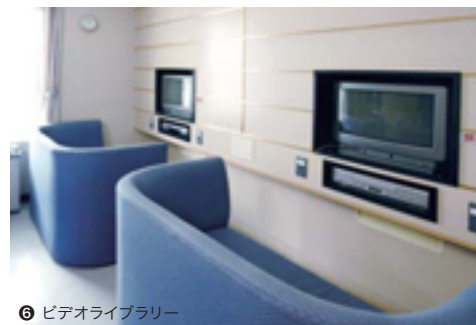
⑥ ビデオライブラリー