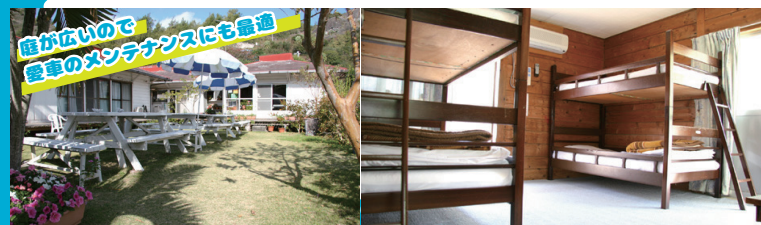
●掲載している写真は全てイメージです。