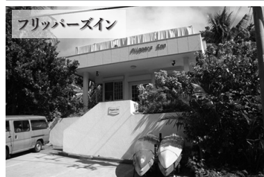
フリッパーズイン